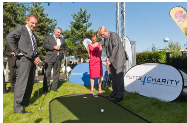
Ministerpräsident Volker Bouffier beim Putten

500 Euro konnten als Erlös an die SOS-Kinderdörfer überwiesen werden.